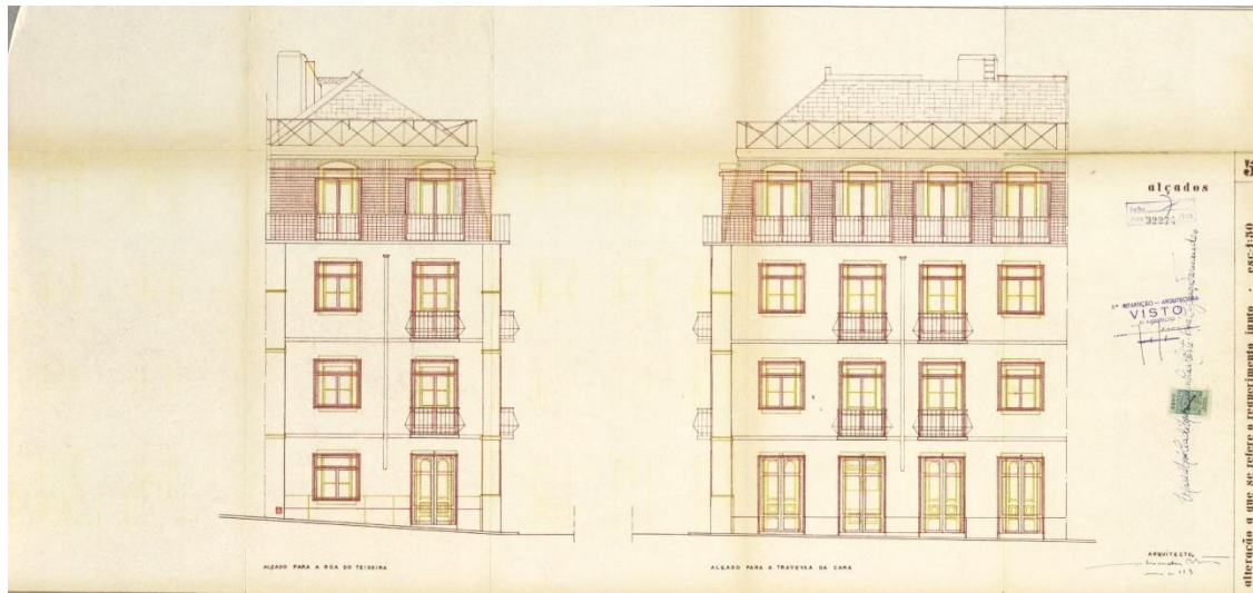
Projecto de alterações, 1963